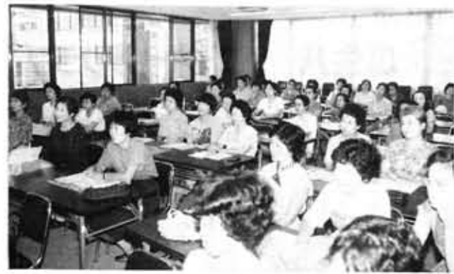
第1回婦人問題講座 考えます、私達の老後を