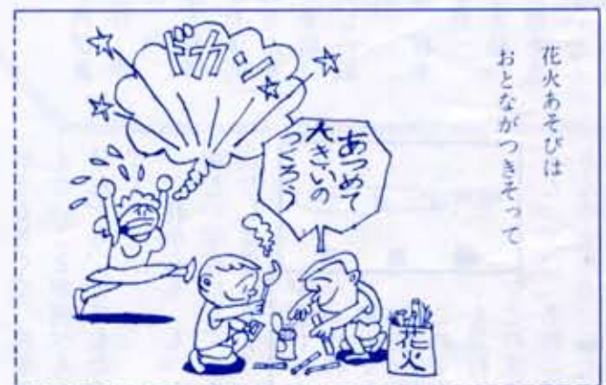
花火あそびはおとながつきそって