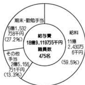
(昭和58年度一般会計 当初予算)