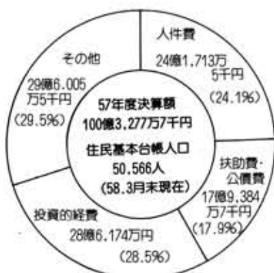
(昭和57年度一般会計決算)

※人件費には、職員給与のほか、特別職(市長、議員など)及び非常勤職員に支給される給料、報酬等が含まれています。