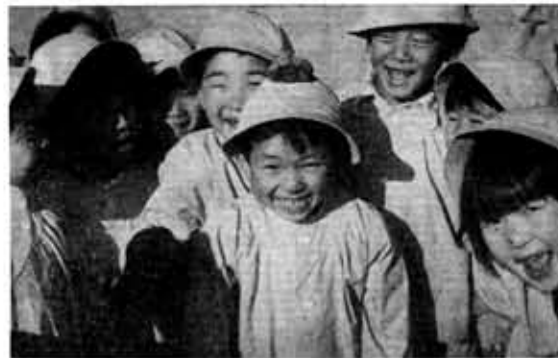
この子たちのために...

環境衛生組合負担金...1億972万円▶し尿くみ取り委託料...9,185万円▶ゴミ・ガラ収集委託料...2,969万円▶ゴミ収集車シャーシ・ロータリーローダー架装費...706万円▶乙訓病舎事務組合負担金...317万円▶母子保健費...252万円▶成人病対策費...243万円▶水質検査騒音測定用器具購入費...44万円など