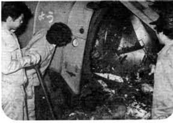
ゴミ・ガラなどをきれいに処理

桂川右岸流域下水道事業負担金...8,982万円▶河川・排水路工事費...5,298万円▶公共下水道設置工事費...3,155万円▶寺戸川都市下水路改修工事費...1,908万円▶市道舗装工事費...988万円▶交通安全対策事業費...715万円▶大牧都市公園・車塚緑地整備費...669万円▶地下道照明灯整備費...179万円など