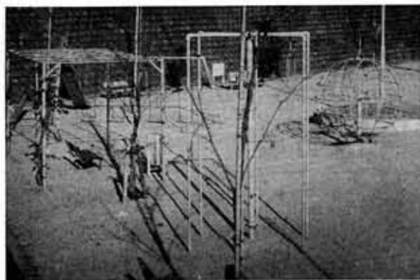
生活にうるおいと公園の整備(大牧都市公園)