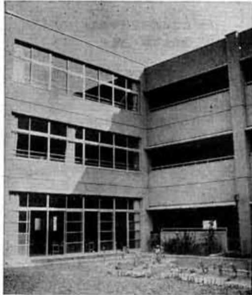
6教室などを増築(第4向陽小学校)

保育所管理費...3億4,141万円▶ボニーの学校事務組合負担金...863万円▶65歳以上の老人医療費...6,011万円▶精神薄弱者援護施設措置費...433万円▶児童福祉手当...363万円▶老人福祉年金...205万円▶無認可保育所入所者補助金...202万円▶身体障害者手当・扶養共済補助など...110万円▶老人健康診査委託料等...79万円▶くらしの資金貸付事業委託料...25万円など