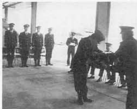
■新型消防ポンプ車のカギの引き渡し■消防団第2分団に最新鋭の消防ポンプ車が配備されました。