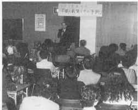
■失明予防講演会■「眼の病気とその予防」に超満員の市民が熱心に耳を傾けていました。