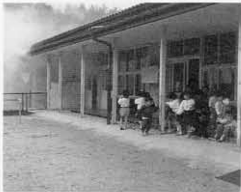
■第4保育所で火災避難訓練■調理室からの出火という想定に子供たちも真剣な表情です。