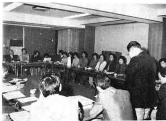
上植野町東自治会とのまちづくり懇談会

市では、広く市民のみなさんへの声を市政に反映する一環として、昭和五十六年度は、とくに地域住民のみなさんとの話し合いの場を積極的にもち、「まちづくり懇談会」を行っています。 「まちづくり懇談会」は、市の施策や方針について、市民のみなさんと市長がひざを交えて話し合い、市民本位のまちづくりを推進していくもので、自治会、町内会や各種団体を対象に「まちづくり懇談会」は、五十六年度は、とくに地域住民のみなさんとの話し合いの場を積極的にもち、「まちづくり懇談会」を行っています。 「下水道はいつ完成するのか」といった地域に密着した問題について、貴重なご意見・ご要望をいただいています。 このように懇談会では、出されたご意見・ご要望は、各担当課にもち帰り、市民の