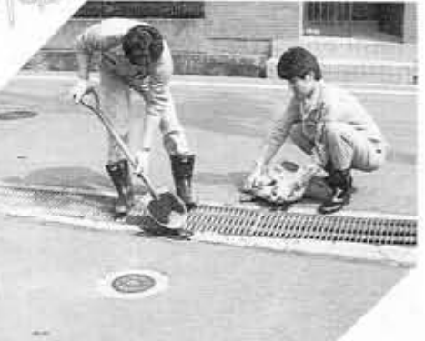
■道路安全点検パトロール■子どもたちやお年寄りを交通事故から守ろうと、カーブミラーや道路舗装などをチェック。