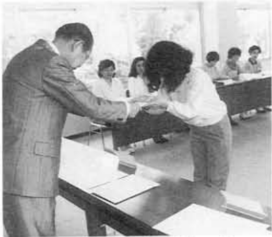
民秋市長から委嘱状を受ける市政モニター

新しく市政モニターとなった19人に、民秋市長が、「市民と行政のパイプ役として活動していただき、21世紀に向かってのまちづくりにご協力をお願いします」とあいさつ。続いてモニターの自己紹介があり「子どもたちにすばらしいふるさとを残してほしい」「地域のことをもっと知り、たい」と、意欲あふれる意見が出されました。