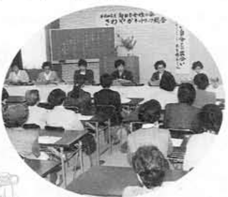
■向日市女性の会さわやかなネットワーク新たなスタート■今年度のテーマは、「新しいライフスタイルと住みよい地域づくり」