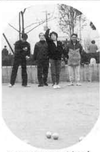
気軽に楽しめるベタンク

平成4年度前期シルバースポーツ教室 生涯スポーツの一環として、楽しみながらだれでも気軽にできるニュースポーツなどを通じて高齢者の健康保持・増進と相互のコミュニケーションを図ります。 日程は、右表のとおり。対象は、市内在住のおおむね60歳以上の男女50人。申込み・お問い合わせは、6月3日(水)までに、所定の用紙(スポーツ振興課で配布)に必要事項を書いてスポーツ振興課(内線3351)へ。後期は、10月中旬に開催予定。※ニュースポーツは、府民トリムの一つ