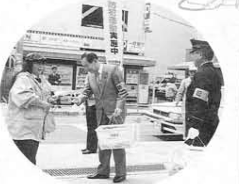
■春の全国防犯活動■「防犯はカギかけ、声かけ、心がけ」と地域ぐるみの防犯を呼びかけました。