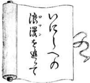
市史編さん活動日誌から④