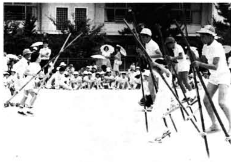
なかなかうまく歩けないなあ

私たちの学校では、六月三十日に竹馬大会をしました。 この竹馬大会は、乙訓の名産の「竹」を使って自分たちの手で普通の竹馬と、コッポリ型の竹馬を作り、それで競技しました。