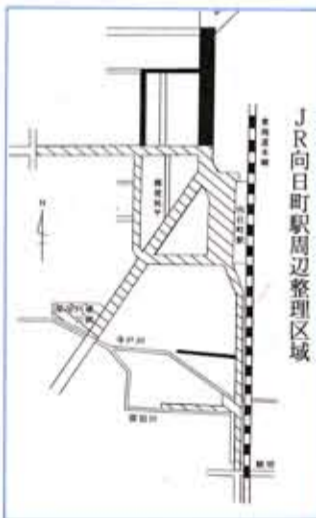
JR向日町駅周辺整理区域

老人福祉センター 4月の行事予定 ☎934-1515 ■交通安全教室 5日(金)午後1時30分～2時30分 ■腰痛体操 8日(月)午前10時45分～11時30分 ■同好会世話人会総会 11日(木)午前10時30分～正午 ■花見バスツアー 12日(月)午前10時40分～午後2時 ■健康相談 9日(火)・26日(金)午後2時～3時30分 ■血圧測定 2日(火)・17日(水)午後1時30分～3時 ■休館日 29日(祝)・各日曜日