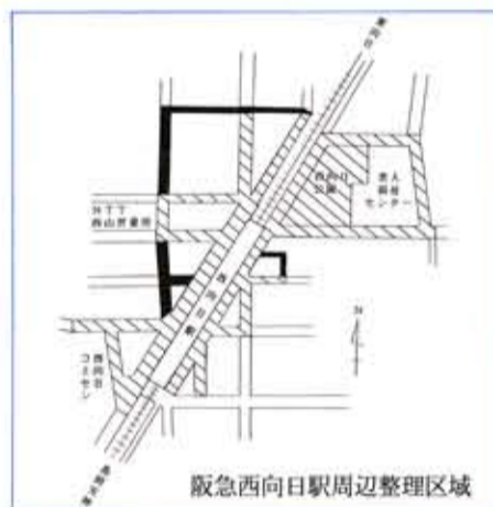
阪急西向日駅周辺整理区域