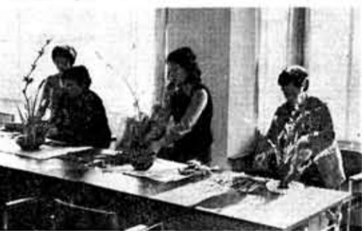
静けさの中に茶道の心が=中央公民館にて=

「おけいこグループ」登録募集中 月二回、会場が無料 中央公民館では、「おけいこグループ」の登録募集も行っています。 三月はそれぞれ月一回とする。祝日に当たった講座は休講とし、くり替えはなりません。また月二回を超える場合は、自主開設となります。 なお、地域ごとにあるクラブは従来どおり地域婦人会へ申込んで下さい。 静けさの中に茶道の心が=中央公民館にて=