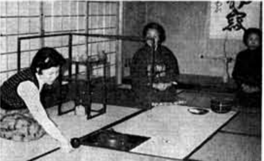
すこしは腕があがったかな? =物集女公民館にて=