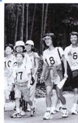
健康づくりや健康文化の創造のため、昨年開催した「いきいき健康ウォーキング大会」

妻に先立たれて一人暮らしを4年。勤めを退いてから2年が経過した。血圧と糖尿などの進行を防ぐために、会社勤めの間は、ラジオ体操と早朝30分の散歩を続けていたが、今では、 ① テレビ体操 NHK教育で午前6時30分からのテレビ体操を春夏秋冬、寒い日もテレビを見ながらやっている。 ② 散歩 午前中に方面を決めて、今日は東の方(国道17号線)から西の方(西向日)まで、次の日は西の方(右京)が大切。 ③ 10~15分の登坂 登坂後にマッサー機で背中と足をマッサージして、食後で眠くなるので10~15分程度(長くてもいけない)の登坂をしている。これで身体も頭もスッキリする。