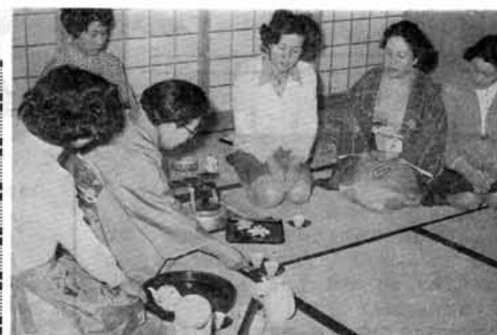
(お茶のおいしい入れ方のコツを学ぶ主婦ら)

商業統計調査 ご協力お願いします 通商産業省では、ことし 施策に役立てようを目的に の五月一日現在で、全国の 行われるものです。 商店を対象に、商業統計調 調査にあたって、都道府 県知事により任命された調 査員が、四月下旬から五月 行われ、わが国の商業と商 品流通の現状の真態を正確 にとらえ、商業流通関係諸 入のお願いに伺いますから