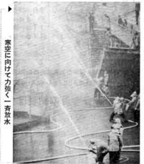
寒空に向けて力強く一斉放水

昭和五十二年の新春を飾る出初式が、一月十五日午前十時から、市役所前広場と競輪場で厳粛に行われました。