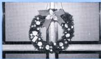
インフォメーション