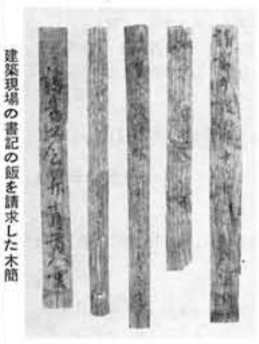
建築現場の書記の飯を請求した木簡