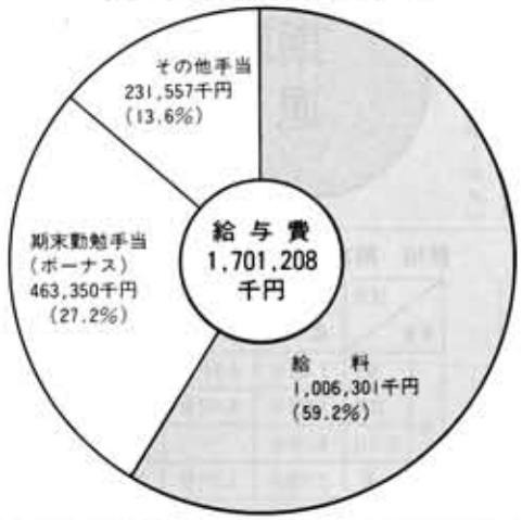
表3 職員給与の状況(昭和56年度一般会計決算)

一般に人件費とは、職員に支出される給与のほか、共済費などの使用者負担を含む広い範囲の費用をいいます。 これを昭和五十五年度一般会計の決算でみると、人件費総額は約二十一億八千四百三十九万五千円であり、これは歳出の総額七十一億八千六百九十二万九千円の三〇・四%に当たります。 昭和五十六年度の一般会計予算における職員給与費の状況は表3のとおりです。 (1)職員一人当たりの年間給与は約三百五十一万四千円(税込込み) (2)給与費は、当初予算に計上された額であり、給与改定分として一・五六%分を含む。 (3)その他の手当は「管理職・調整・扶養・通勤・時間外勤務・特殊勤務・住居などの手当」です。なお、管理職手当・特殊勤務手当などすべての職員に支給してないものも含んでいます。