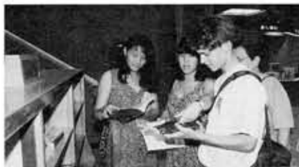
図書館を見学するサラトガ市交換学生(昨年)

申し込み 4月20日(木)までに所定の用紙で市役所秘書広報課まで お問い合わせ 市役所秘書広報課 ☎931-1111