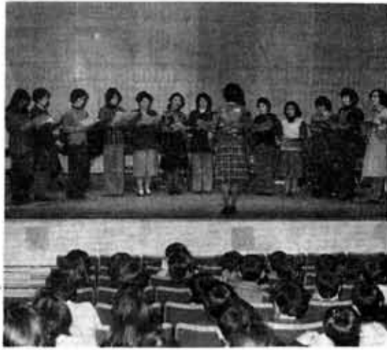
ママさんコーラスの美しいハーモニー

▽日時・場所 11月5日(土) 午後2時 市民会館ホール ▽参加対象 市内在住の方、または向日市内に勤務しておられる方で、アマチュアグループとして、また職域グループとして音楽活動をされている方 ▽音楽対象 合唱に限ります ▽申込み方法 所定の参加申込書にグループのリーダー、あるいは責任者(成人者)を記入のうえ申込んで下さい。申込書は、中央公民館にあります。 ▽申込み期間 10月1日~23日(ただし