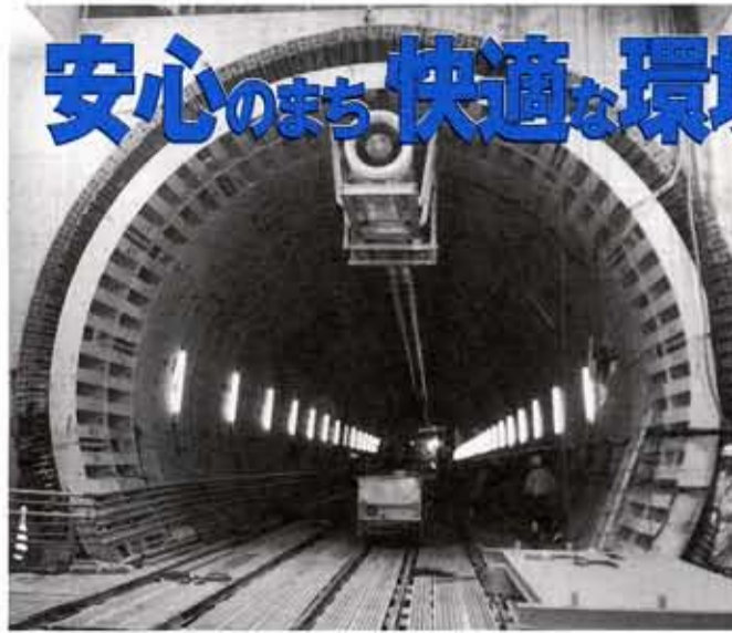
呑龍トンネル(管径8m)