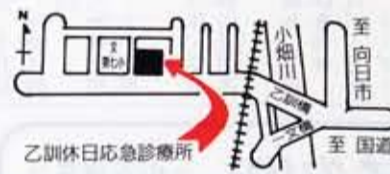
乙訓休日応急診療所 至 向日市 至 国道171号線