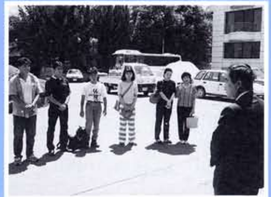
向日市・サラトガ市交換学生7月29日に出発、8月9日に親善を深めて帰国しました。