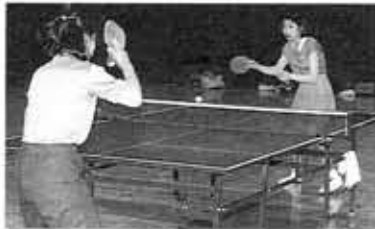
卓球の普及に努めています