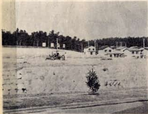
宅地造成の進む丘陵地帯