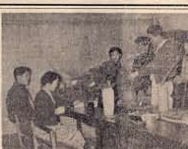
映画教室「娘は娘、母は母」

婦人学級の集いです。娘に教えられる母、母親によるこぶ娘、心は一つにとけあつて、温かい家庭が育つていく