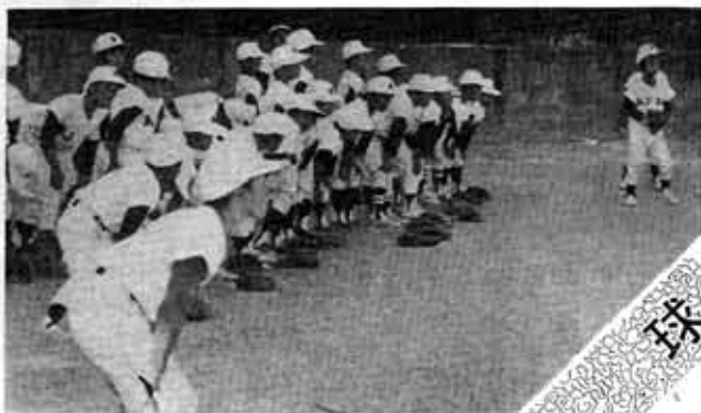
47年度より 全京都少年野球大会出場 48年 学童の部優勝 50年 中学の部優勝、近畿大会ベスト4