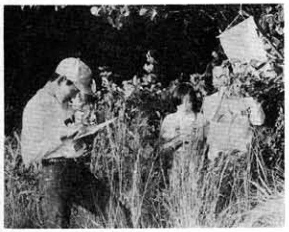
地図の読み方、磁石の使い方をよく勉強して