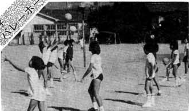
51年度より 全日本少年少女バレーボール大会出場 各ゾーン3位に全チーム入賞(3チーム)