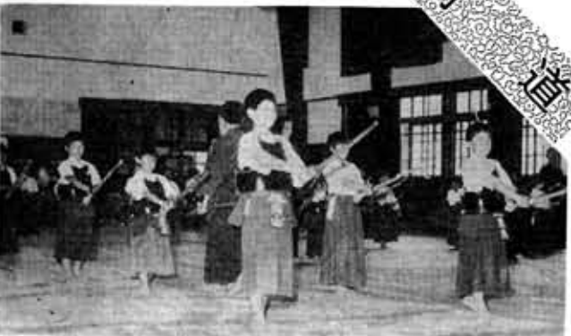
乙訓剣道大会等に出場 他団との交流会