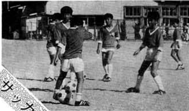
44年 京都少年サッカー大会準優勝 50年 京都少年サッカーリーグ戦参加 毎年京都少年サッカー大会出場 優秀選手多数