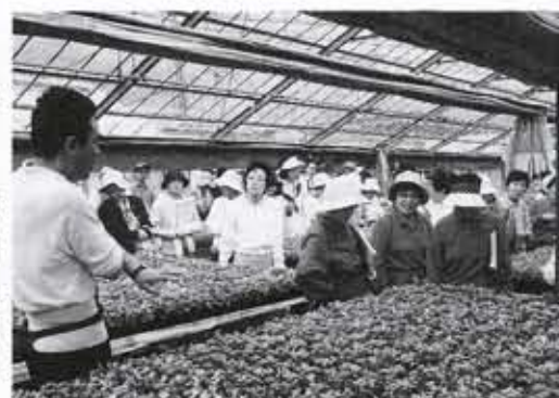
5月13日・農家の生産現場 を見学(農業みてるあるき)