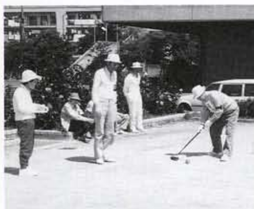
5月19日・競技を通じて親睦 を深める(第14回向日市老人ク ラブゲートボール大会)