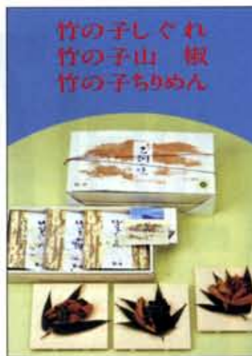
竹の子しぐれ 竹の子山椒 竹の子ちりめん

※各乗降所には、案内看板 を設置しています。交通事 情により、運行時間が変わ る場合があります。