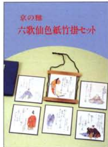
京の雅 六歌仙色紙竹掛セツ