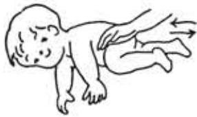
寝返りによる肘支持練習

では寝返りやハイハイをしっかりとさせるには、どうしたらよいのでしょうか。 ①なるべく薄着で動きやすい服装をさせる。冬でも室内ではくつ下はいりません。膝や足がじかにさわれるように出しておきましょう。 ②うつ伏せで遊ばせる。生後2ヶ月を過ぎたら、少しずつ慣らして回数や時間を増やしていきましよう。