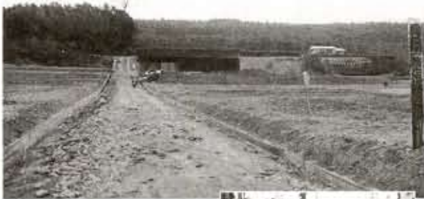
昭和35年頃、物集女町出口(現・物集女派出所前)から西方を望む