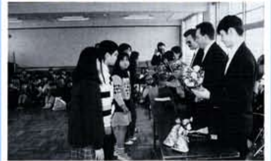
京都府と友好提携を結んでいるロシアのレニングラード州の行政関係者が向日陽小学校を視察。児童たちは、日本の伝統的な遊びや食文化を紹介しました。