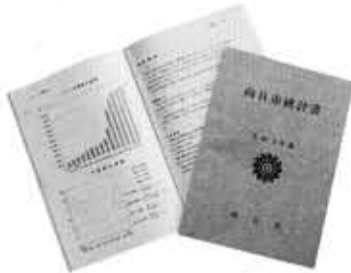
B5版 179ページ1冊 1,500円

平成5年版「向日市統計書」を会計課の窓口で販売しています。この統計書は、市の人口、経済、産業、行政など各分野にわたる統計資料を総合的に系統的に収録しています。