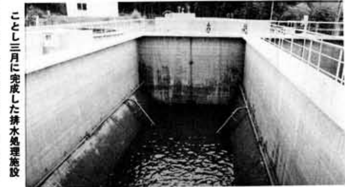
ことし三月に完成した排水処理施設