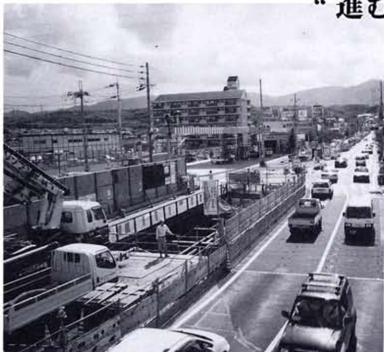
京都府桂川右岸流域下水道雨水北幹線1号管渠工事中 内径8m延長935mの貯留管が道路下に埋設されます。

本市の下水道事業は、昭和49年度より京都府桂川右岸流域関連向日市公共下水道事業として汚水事業から着手しました。 「都市文化のパロメーターは下水道から」といわれておりますように、下水道は川を美しく、豊かな自然環境を保全し、伝染病などの予防や地下水の水質保全にも役立ち、生活改善に欠かすことのできない施設であります。 本市では汚水事業の着手以来、快適で「緑やさしく安心のまち」づくりに向け積極的