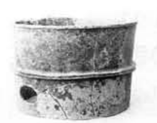
▲鹿を線刻した遺物 (鶴冠井町大極殿古墳出土)