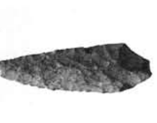
▲有舌尖頭器 (寺戸町殿長遺跡出土)