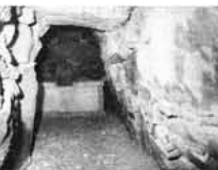
▲物集女車塚古墳 (石室内部)