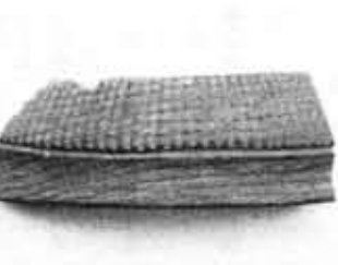
▲石 剣 (上植野町芝本遺跡出土)