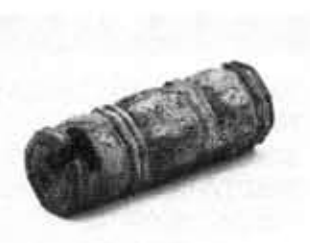
▲金銅製鎌子 (上植野町南定井出土)

昭和五十七年六月の遺跡地図の改定以後、新たに十二の遺跡が発見され、十一の有形文化財が市指定文化財となりました。また、物集女車塚古墳、南真経寺本堂・開山堂、須田家住宅が京都府の指定文化財に、向日神社本殿の棟札が国の重要文化財に追加指定される等、向日市をとりまく文化財の状況は益々意義深いものとなっています。そこで新たに発見されたり、内容の変更された文化財を簡単に御紹介しておきます。