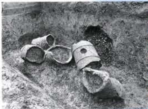
上植野町のNo.76西小路古墳では、墳丘から転落した円筒埴輪が多数見つかりました。