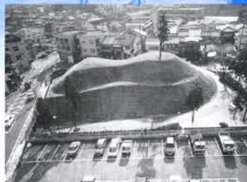
物集女町のNo.8物集女車塚古墳は、整備され車塚緑地として市民の憩いの場となりました。