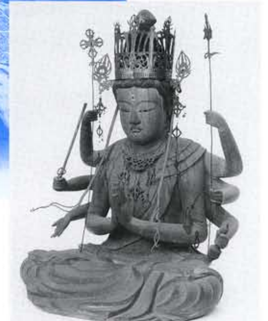
市指定文化財No.21木造不空羂索観音坐像