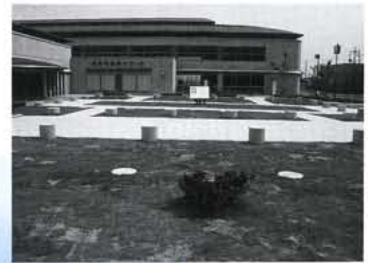
鶏冠井町の市史跡No.22東院跡は向日市民プールの一面に復原整備されて保存されています。