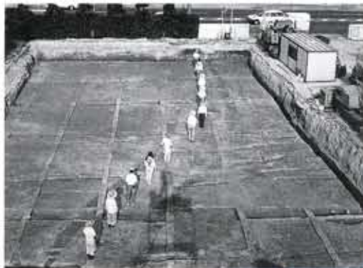
森本町のNo.70高田遺跡では弥生時代のムラとムラを結ぶ道が発見されました。

改訂された新しい遺跡地図では、新しく13箇所が加わり、18箇所範囲が変わりました。