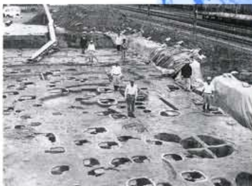
寺戸町のNo.67久々相遺跡では整然とならんだ建物群が発見され、奈良~平安時代のムラや役所跡であることがわかりました。