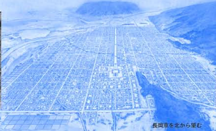
長岡京を北から望む