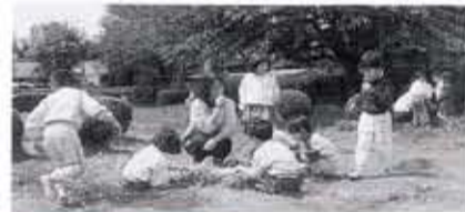
市民の散策と憩い の場を整備します