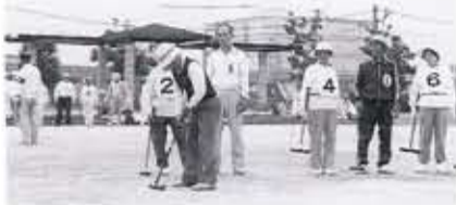
ゲートボールを 楽しむお年寄り