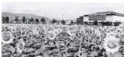
ひまわり観賞園な ど農業振興にも取 り組んでいます