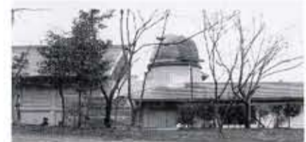
7月にオープンす る向日市天文館