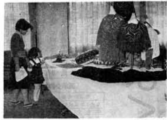
“見てください、この成果” 物集女公民館の学習発表会

グループ 申込みは中央公民館 中央公民館では「グループ」の登録募集も行っています。この「グループ」は、教