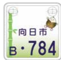
▲特定小型 原動機付自転車