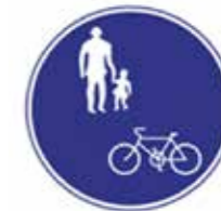
▲規制標識 「普通自転車等及び歩行者等専用」

※詳細は京都府警察ホームページ掲載の「自転車の交通ルール」でご確認いただけます。