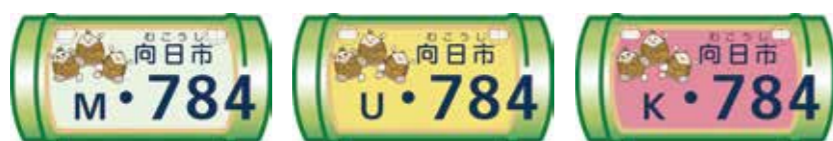
▲原動機付自転車 50cc以下