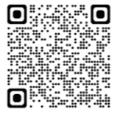
▲聴竹居倶楽部ホームページ