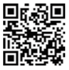
▲停電情報アプリ(関西電力送配電)

台風襲来時や落雷、地震発生の際は、電力設備への被害などにより停電する場合があります。