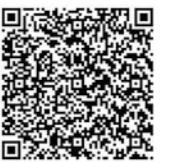
▲電子申請フォーム ※4月1日から申請可能です。