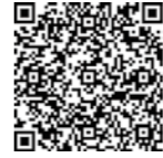
▲淀川河川事務所ホームページ

書に必要事項を記入の上、メールまたはファクスで、担当出張所へ。申請書は淀川河川事務所のホームページからダウンロードできます。※事前に担当出張所へ電話で連絡してください。