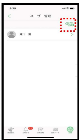
【おさるさん+】マークを選択