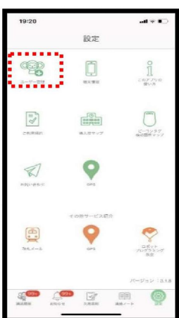
設定より、ユーザー管理を選択 もしくは各メニューの右上 【おさるさん+】マークを選択