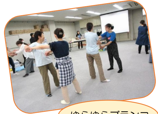
ゆらゆらブランコ