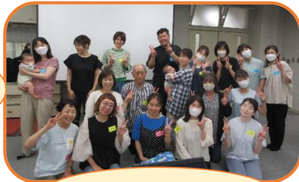
みんな一緒に ハイポーズ!