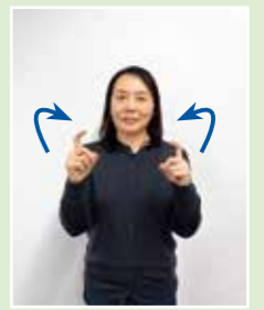
人さし指を内側に向けて曲げる(あいさつの手話)