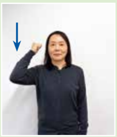
右手の握りこぶしをおろす