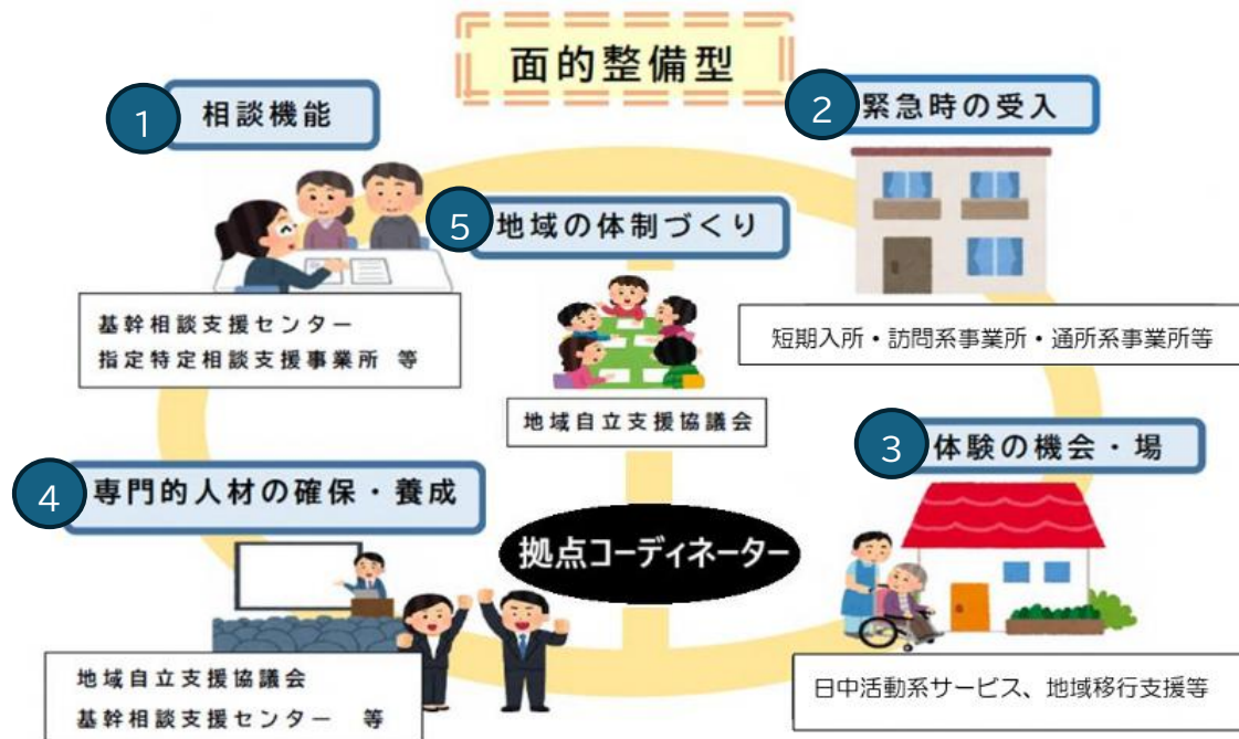
《面的整備型のイメージ》

乙訓圏域では、自立支援協議会において平成30・31年度に「地域生活支援拠点部会」が設置され、圏域での現状や課題の整理、求められる機能についての協議を行いました。この協議内容を踏まえ、複数の機関が分担して機能を担う【面的整備型】を採用し、整備を行うこととしました。