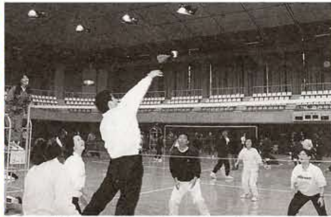
家族みんなで気軽に楽しめる軽スポーツです

子供からお年寄りまで、年齢や体力に関係なく、だれもが気軽に楽しめるのが軽スポーツです。この軽スポーツを市民のみならずにより親しんでいただくために、今年も向日市民軽スポーツ交流大会を次のとおり開催します。お気軽にご参加ください。